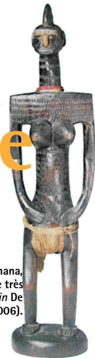
1. Statue bamana, figurine très géométrique, in De Saint Angel E. (2006).