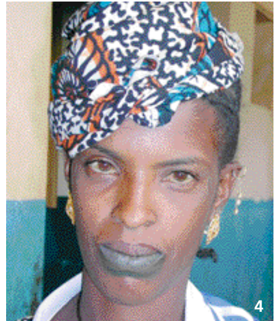
4. Femme toucouleur avec un tatouage labial.

travers des pratiques motivées par le besoin d'embellissement (6).