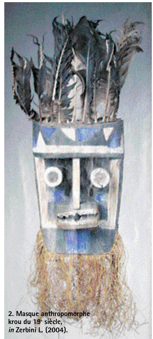
2. Masque anthropomorphe krou du 19 e siècle, in Zerbini L. (2004).

Cependant, l'influence de la colonisation a contribué à modifier certains aspects de ces canons esthétiques. Cela s'est manifesté par des pratiques comme la dépigmentation de la peau à la recherche d'un teint plus clair se rapprochant de celui de la femme blanche, le défrisage des cheveux en vue de les rendre plus lisses et plus faciles à coiffer.