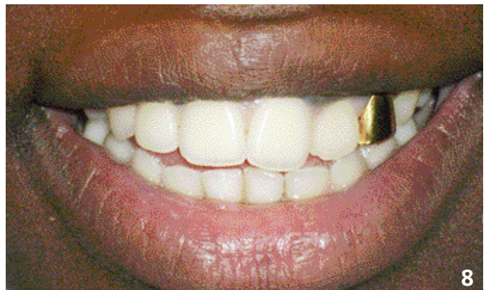
8. Couronne artisanale en or chez une jeune femme sénégalaise.

La demande esthétique vise à harmoniser « l'être et le paraître » (12). Pour séduire et afficher leur aisance socio-économique, certains patients considèrent la dent comme un bijou et sollicitent la réalisation de prothèses en or dont l'impact esthétique reste la première motivation. On les observe