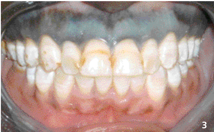
3. Gencive maxillaire tatouée d'une femme sénégalaise